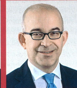
Gregor Rutz Nationalrat und Präsident HEV Zürich