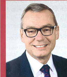
Ruedi Noser Ständerat